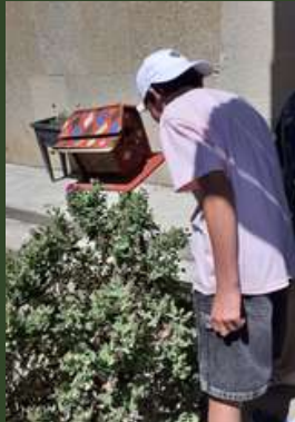
Élémentaire Croix Rouge, Orange.