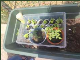
Maternelle Jean Moulin, Cavillon.