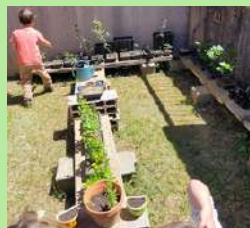
École du Fourniguié, St Christol.