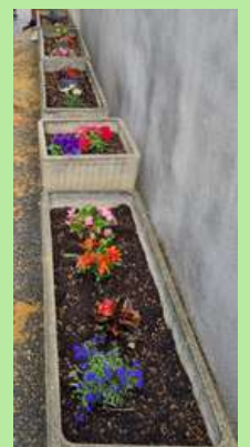
École primaire, Grillon.