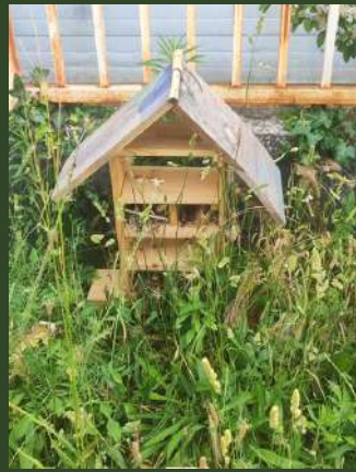
École Les Amandiers B, Carpentras.