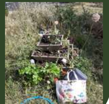
Élémentaire J-H Fabre, Sérignan du Comtat.