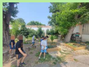
Élémentaire Vertes Rives, Montfavet.