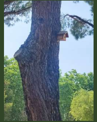
Collège Alphonse Tavan, Montfavet.