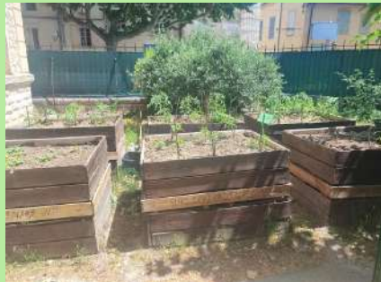
Élémentaire Castil Blaze, Cavailon.