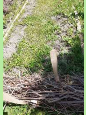
ULIS Collège B. Hendricks, Orange.