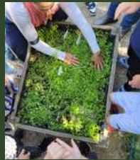
CE1, élémentaire J. Moulin, Mondragon.