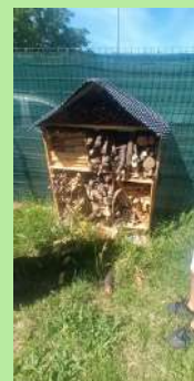
Élémentaire Les Ratacans, Cavillon.