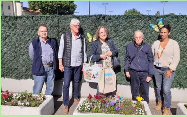
Maternelle Castel, Orange.