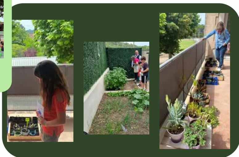
École primaire, Visan.