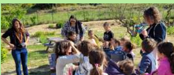
École primaire Les Moulières, Pertuis.