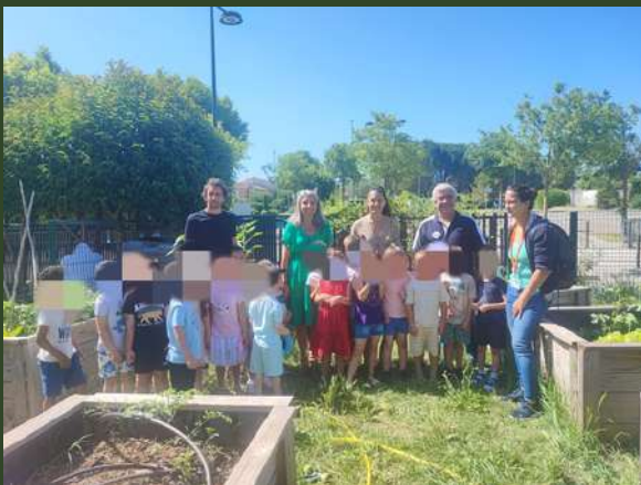
Maternelle La Condamine, Mazan.