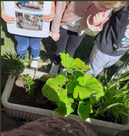
CP élémentaire J. Moulin, Caderousse.