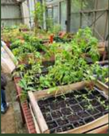
SEGPA Collège Boudon, Bollène.