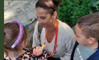
Maternelle Coudoulet, Orange.