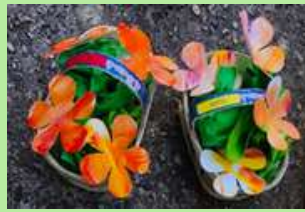
Maternelle P. de Loye, Sérignan du Comtat.