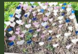
Maternelle M. Pagnol, Piolenc.