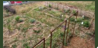
ULIS et écodélégués Collège V. Schoelcher, Ste Cécile les Vignes.