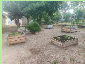
Maternelle Louis Pergaud, Le Pontet.