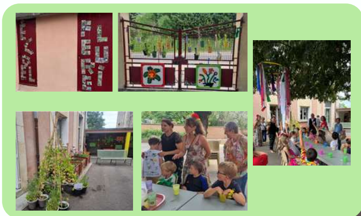
École primaire, St Roman de Malegarde.