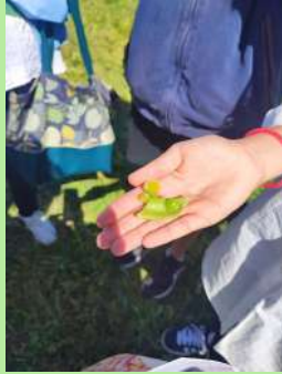
Collège Jean Garcin, Isle sur la Sorgue.