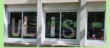
Élémentaire J. Giono Bollène.