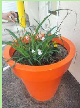
Maternelle du Parc, Sorgues.