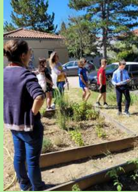
Collège Le Luberon M. Tamisier, Cadenet.