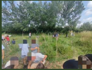
École Les Pins, Loriol du Comtat