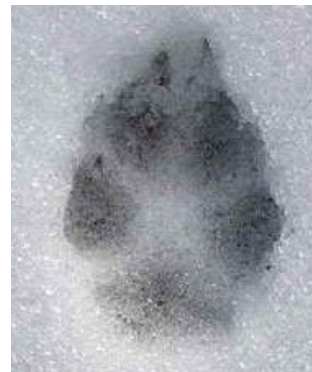
Empreinte de renard dans la neige