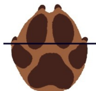
Empreinte de chien (3 à 14 cm)

Contrairement au renard, la droite passant par le haut des coussinets externes coupe nettement les coussinets internes.