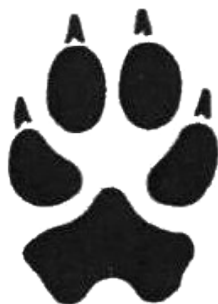
Empreinte de loup 12 cm)