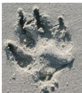
Empreinte de chien dans le sable