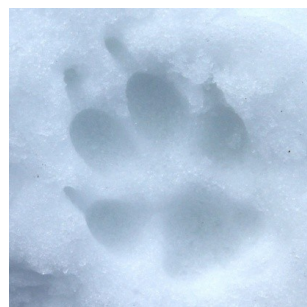
Empreinte de loup dans la neige